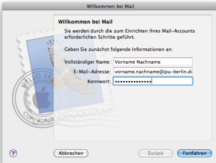
Abb. 1: Richten Sie ein neues E-Mail-Konto ein und geben Sie Ihre Daten an. Das Passwort ist dasjenige, das Sie beim ersten Verbinden mit dem VPN selbst vergeben haben