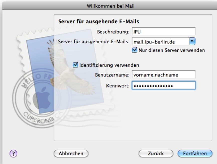
Abb. 5: Der Server für ausgehende E-Mails lautet mail.ipu-berlin.de und erfordert eine Identifizierung mit den gleichen Daten wie der Posteingangsserver