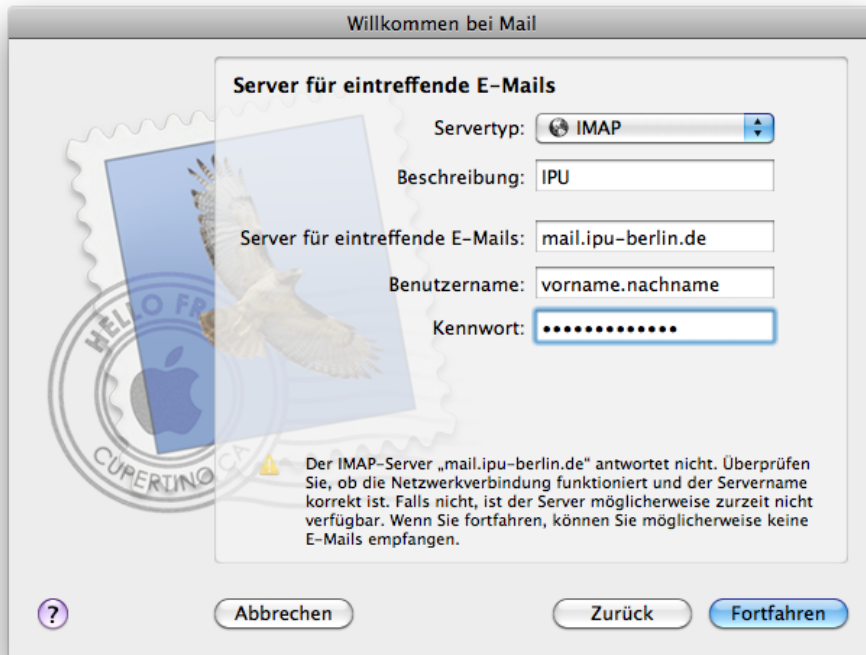
Abb. 3: Die Fehlermeldung wie angegeben können Sie ignorieren und auf Fortfahren klicken