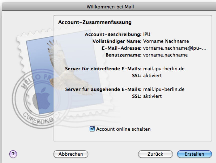
Abb. 8: Die Zusammenfassung sollte aussehen wie angegeben