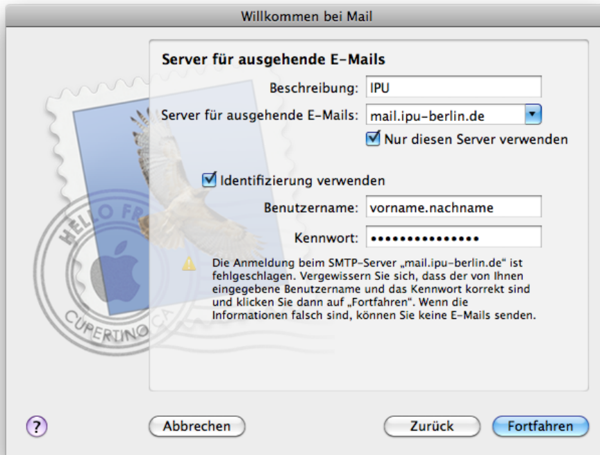
Abb. 7: Eine eventuelle Fehlermeldung wie angegeben können Sie an dieser Stelle ebenfalls ignorieren